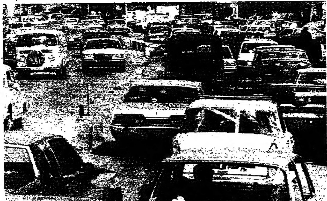
ازدحام على طريق الخزيمة - من الشبيك (جوزيف فضل، بشارة الشاهين)